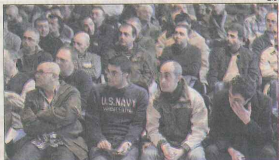
Los afiliados a CC OO y UGT, ayer, en la reunión

La propuesta ha recibido el respaldo mayoritario de los 800 trabajadores que se reunieron ayer en asamblea en las cocheras de Sants, en la ciudad condal, para analizarla y votarla. De esta forma, CC OO y UGT, que juntos suman mayoría en el comité de empresa de la planta de la Zona Franca, pretenden reanudar la negociación con la compañía, que ya da por perdida la posibilidad