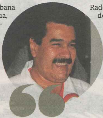
Nicolás Maduro «Hacemos guardia para acompañar al presidente Chávez. Nos turnamos»

Radonski, criticó los viajes de las autoridades a Cuba. «Ahora Maduro viene con el cuento de que quieren atender contra su vida y la de Al Capone (Diosdado Cabello) ¡pura paja!», comentó en Twitter.