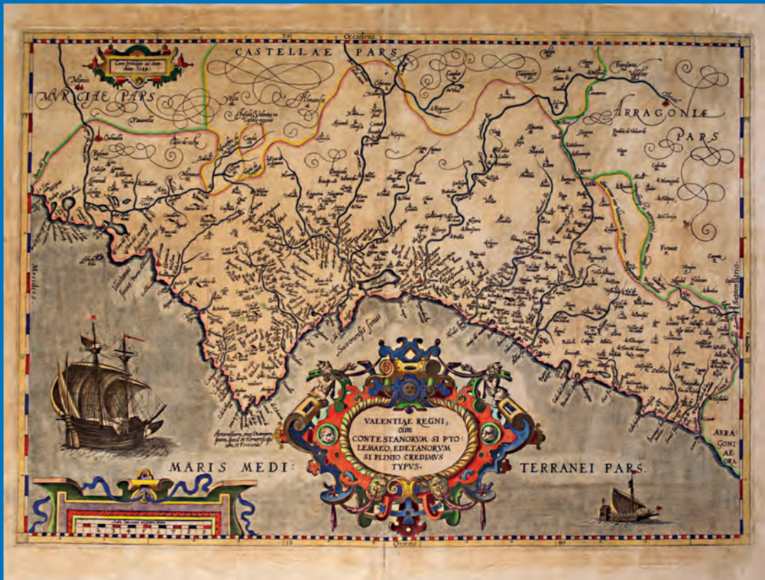
Mapa del Reino de Valencia de Abraham Ortelius (1584) Biblioteca Valenciana Nicolau Primitiu