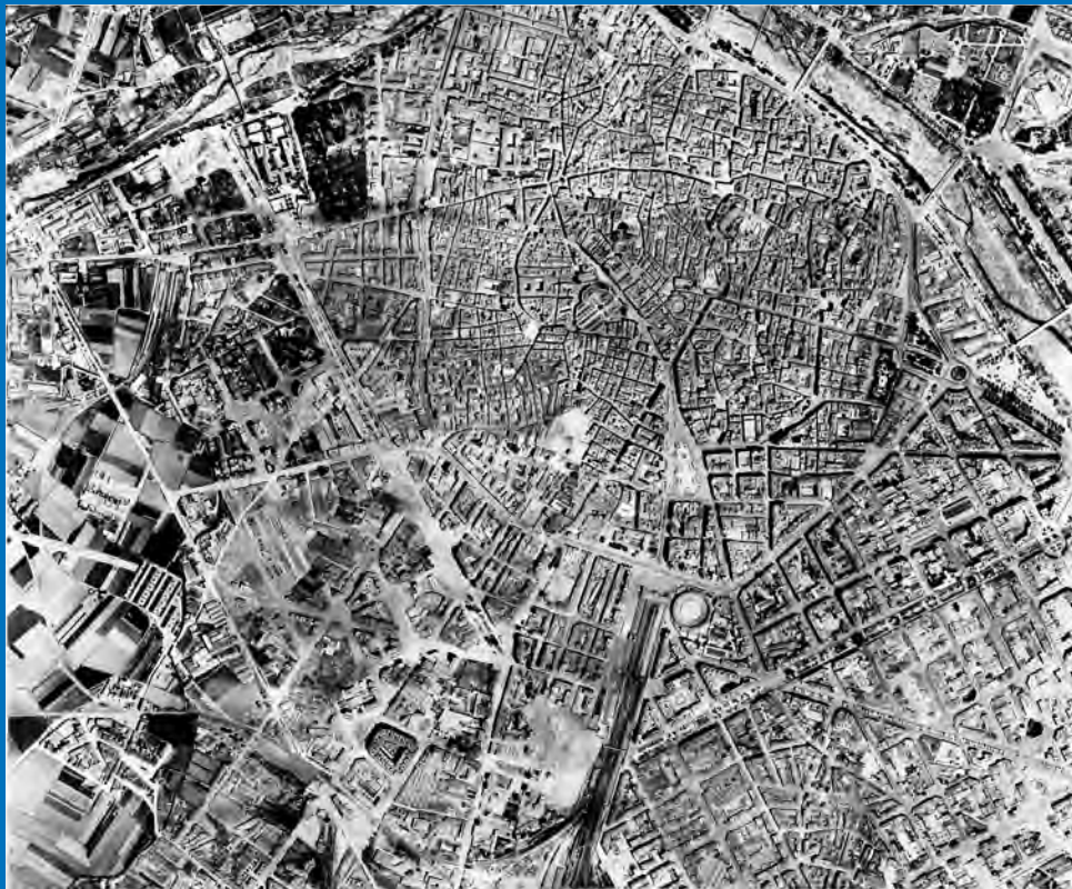
València (1948) Biblioteca Valenciana Nicolau Primitiu. CEFTA