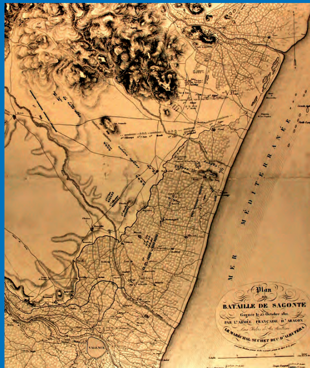
Sitio de Sagunto. En: Suchet, Louis Gabriel. Mémoires du Maréchal Suchet. Paris: Adolphe Bossange, 1828

La historia de las representaciones cartográficas en tierras valencianas dispone de una partida de bautismo clara y temprana: 1584. Antes que otros territorios (Cataluña no dispuso de un mapa impreso hasta 1603), el reino de València fue representado por primera vez en aquel año, con el mapa conocido como de Abraham Ortelius, que fue su editor. A partir de aquí, se han producido una serie de representaciones cartográficas sobre nuestras tierras. La Biblioteca Valenciana, depositaria de buena parte de la memoria material de la sociedad valenciana, dispone de un riquísimo tesoro cartográfico que esta exposición quiere mostrar. A partir de una selección inicial de las piezas más valiosas y más interesantes, la exposición es una oportunidad única de ver reunida una completa representación de cómo el territorio valenciano ha estado representando a lo largo de los siglos. Y es que, como dijo el geógrafo Friedrich Ratzel, en el espacio leemos el tiempo.