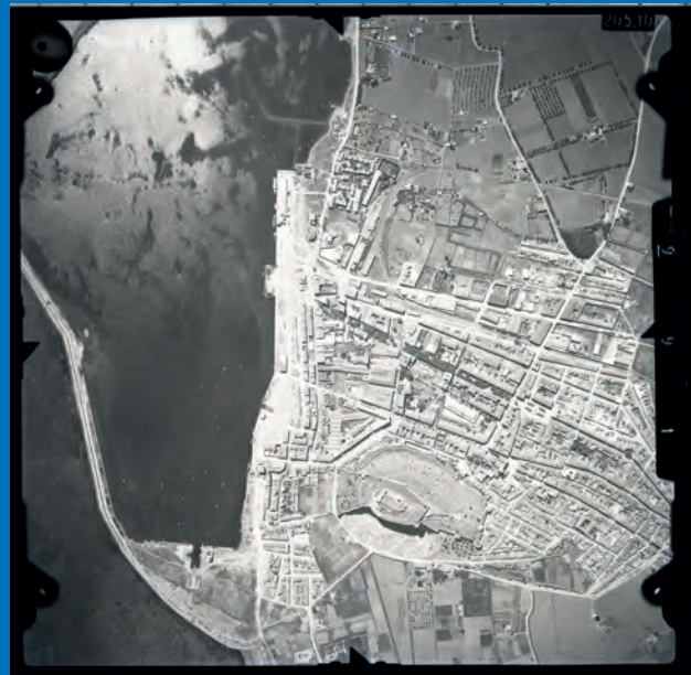
Dénia (1958)

técnica que abrió una nueva etapa en la manera de representar el espacio siguiendo las tendencias francesas, y , finalmente, un grabado de principios del XVIII del conocido plano de 1704 del oratoriano Vicent Tomàs Tosca, del que tan solo se conserva otra copia a la Bibliothèque Nationale de France. La Biblioteca Valenciana ha querido compartir esta pieza esencial de la cartografía urbana europea aprovechando la conmemoración de los 300 años de la muerte del autor que dio origen a este grabado, el padre Tosca (1651-1723).